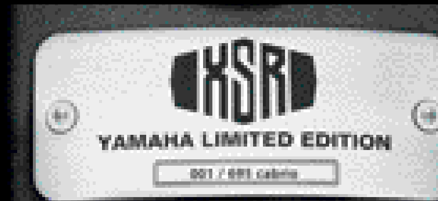
La placa numerada identifica la exclusividad de esta edición, en la que se dispone de 695 modelos de cada versión

“Mi problema es que en mi caso, están uno al lado de otro. Les encanta cambiarse de sitio todo el rato, empujándose, hablando siempre el uno del otro. Y ahí estoy yo, tomando lo mejor que este encuentro ha creado.”