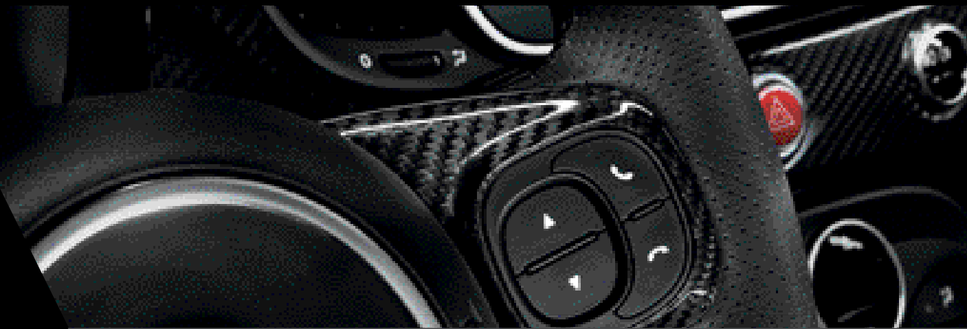
Volante deportivo de cuero y Alcantara® con marca central y detalles de carbono