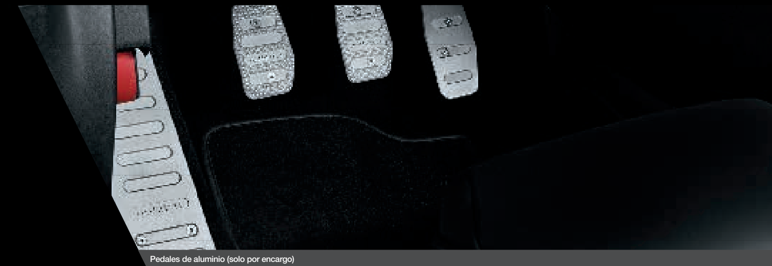
Pedales de aluminio (solo por encargo)